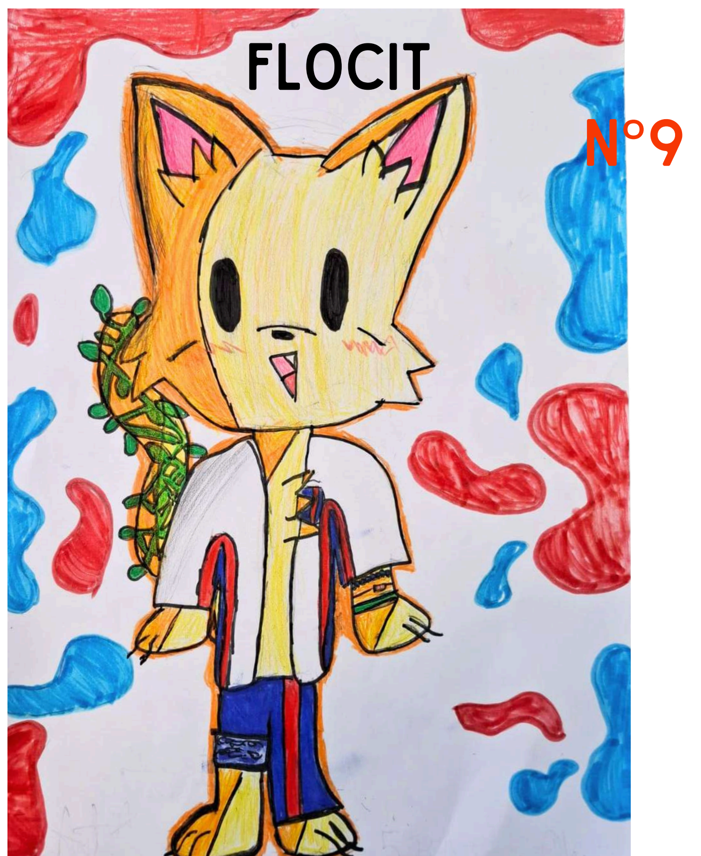
Yo escogí al puma, porque siento es parecido al colegio, alumnos y profes. El puma es atlético, está hecho para el deporte y hay muchos niños en el colegio que les encanta el deporte (me incluyo). Su personalidad es alegre, solidario, respetuoso y nunca se enoja, tiene mucha personalidad. 5° BÁSICO