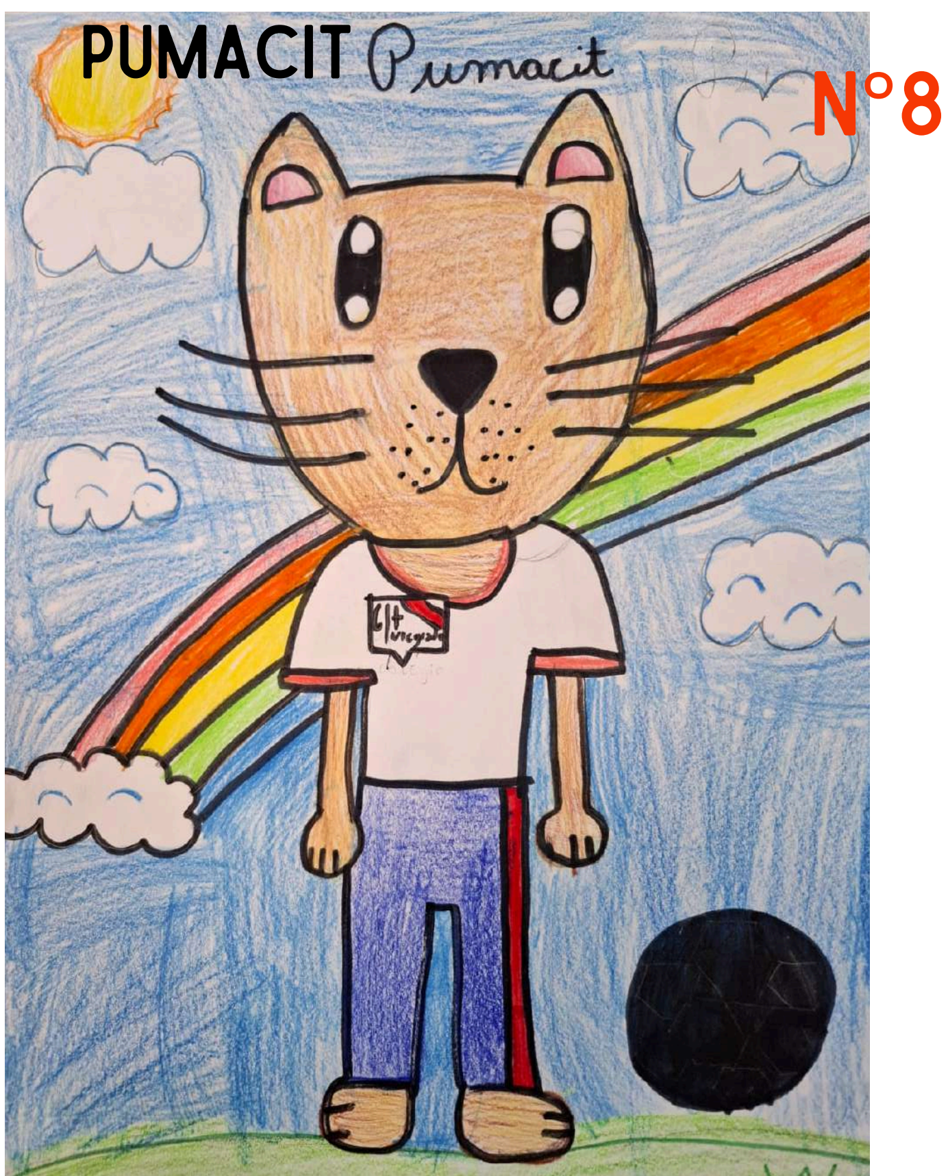
Yo escogí al puma porque es un animal que más nos representa en la región del Maule. 2° BÁSICO