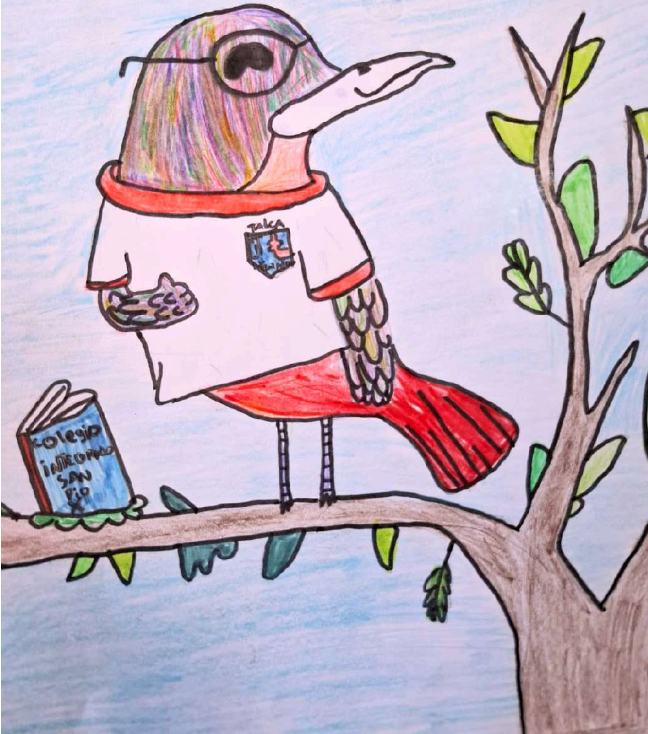
Escogí esta ave porque me gusta y siento que nos representa y para demostrar el talento . 4º BÁSICO