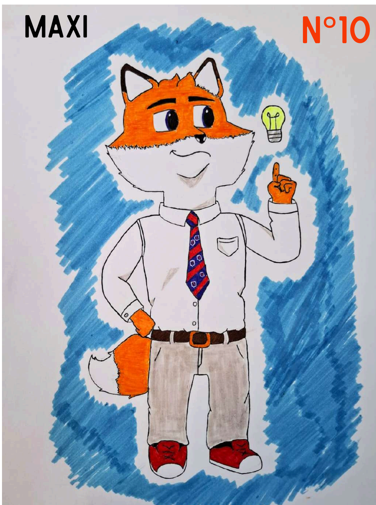
Elegí el zorro, por ser un animal hermoso, con liderazgo, compañerismo. 8° BÁSICO