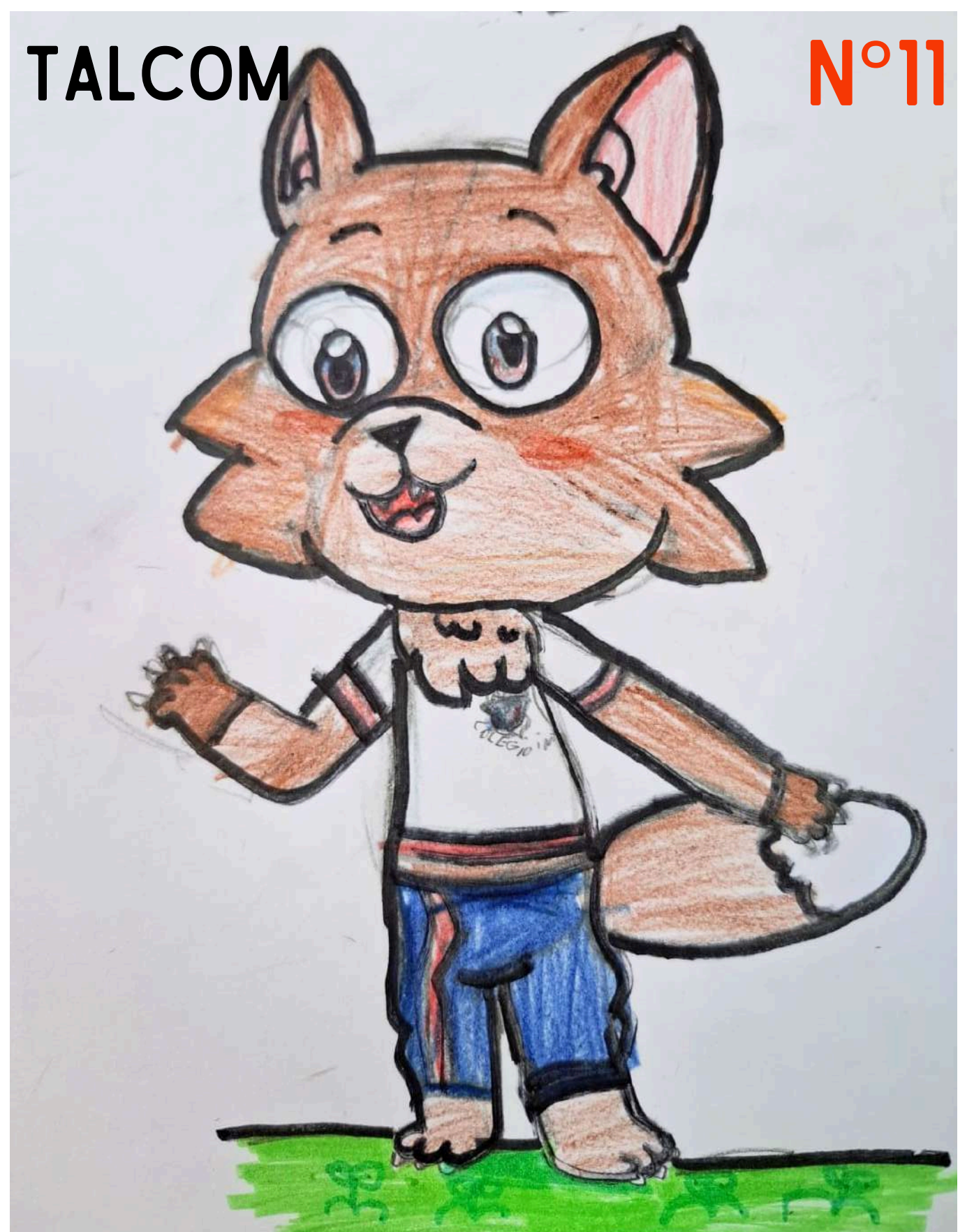
Talcom es un zorro, animal típico de la región. 2° BÁSICO