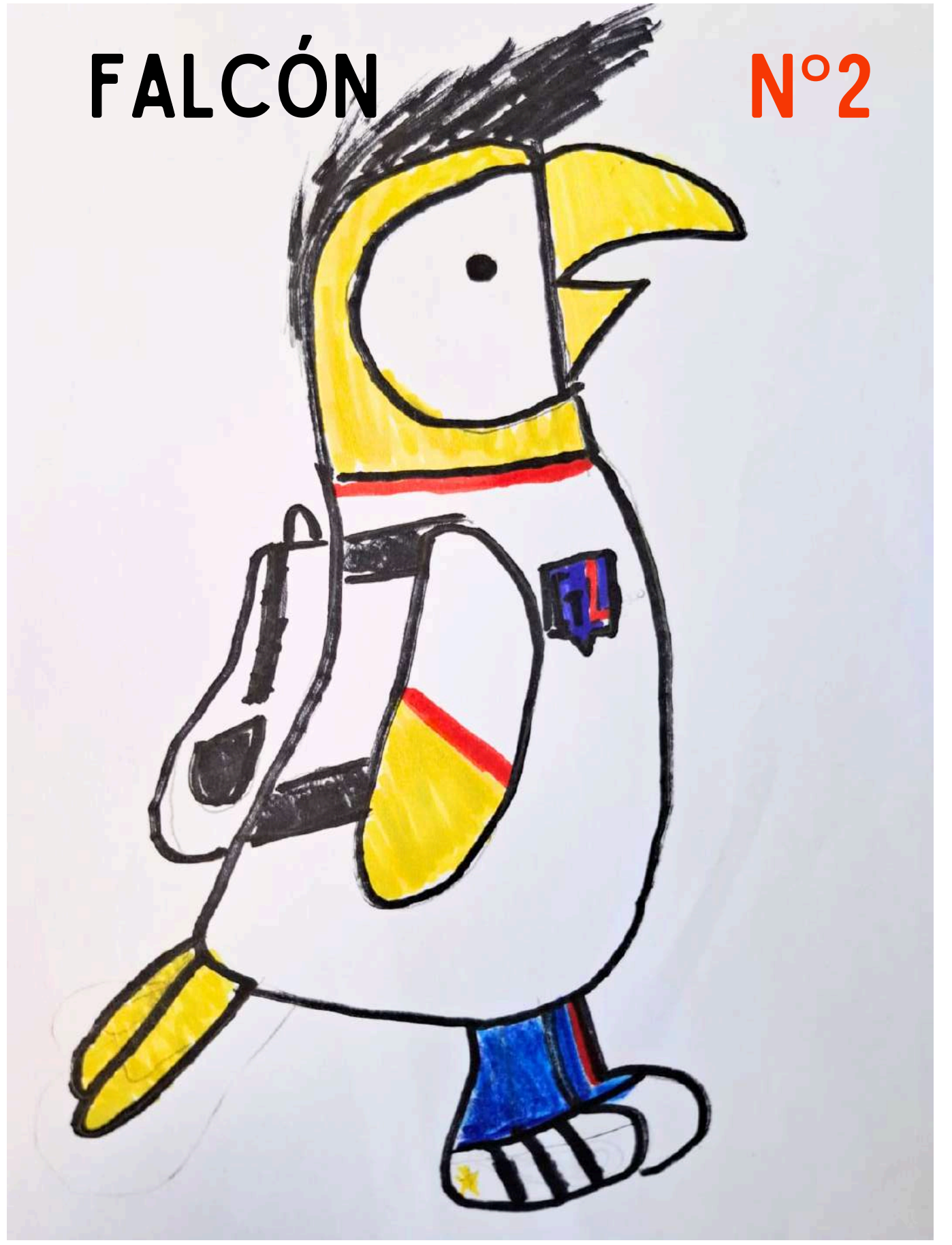
Lo escogí porque es bonito y son únicos como nosotros. 5º BÁSICO